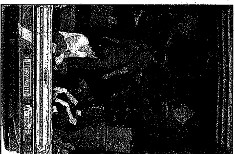
Qui sotto il campo lavoro allestito nel parcheggio più grande dell'Acquario di Cattolica

può lasciare il proprio nominativo in parrocchia o presso la segreteria del Campo delle varie città. Sul sito tutte le info: www.campolavoro.it .